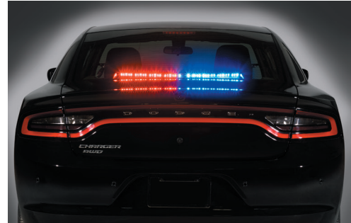
يُعرض SIFMJR على مركبة دودج تشارجر موديل 2018