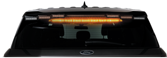
يُعرض SIFMJH على مركبة فورد إنترسبتور يوتيلي لعام 2020