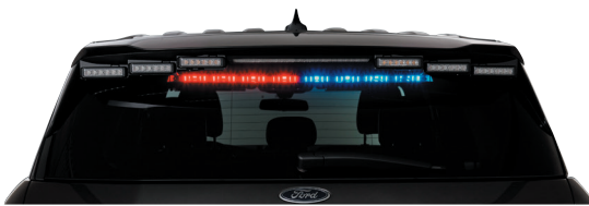
يُعرض SIFMJH على مركبة فورد إنترسبتور يوتيلي لعام 2020