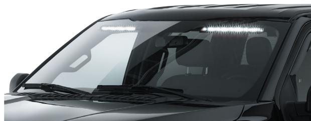
Se muestra el SIFMJS en un Ford F-150 2019