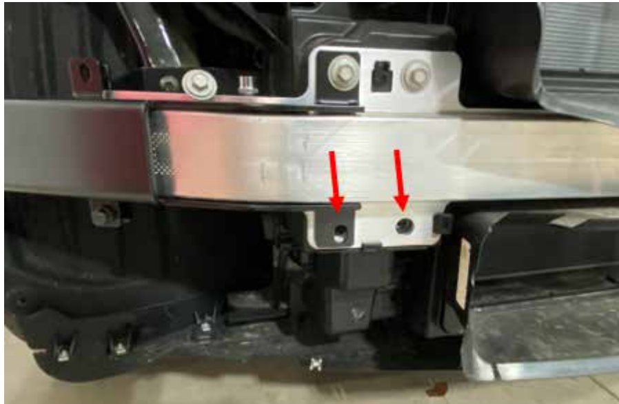
Figura 1 Pernos (se muestra el lado del acompañante)

NOTA: Pueden ser necesarias algunas modificaciones adicionales en el área de montaje.