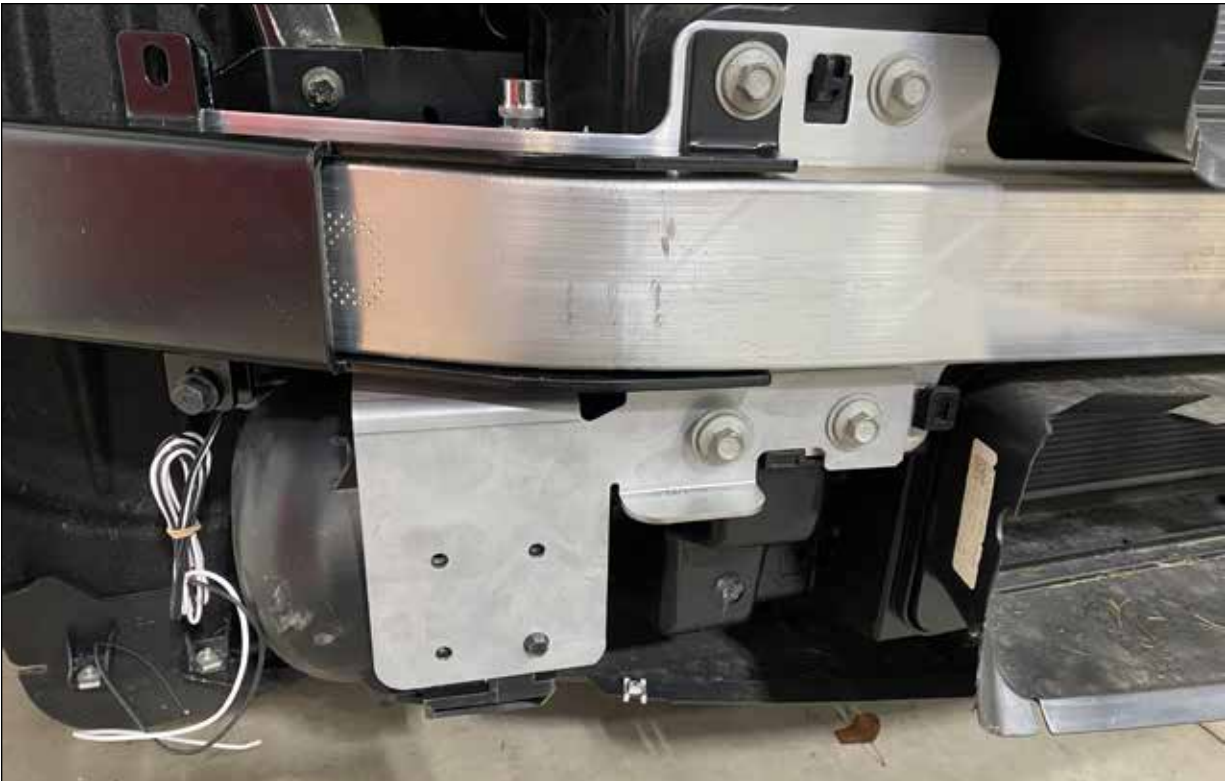
Figura 3 Soporte (se muestra el lado del acompañante)

NOTA: Al montar el soporte del lado del conductor, vuelva a ubicar el montaje del mazo de cables de caucho que se encuentra detrás del paragolpes del lado del conductor.